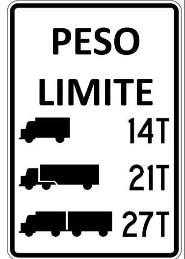
R12-5 Weight Limit (symbols)